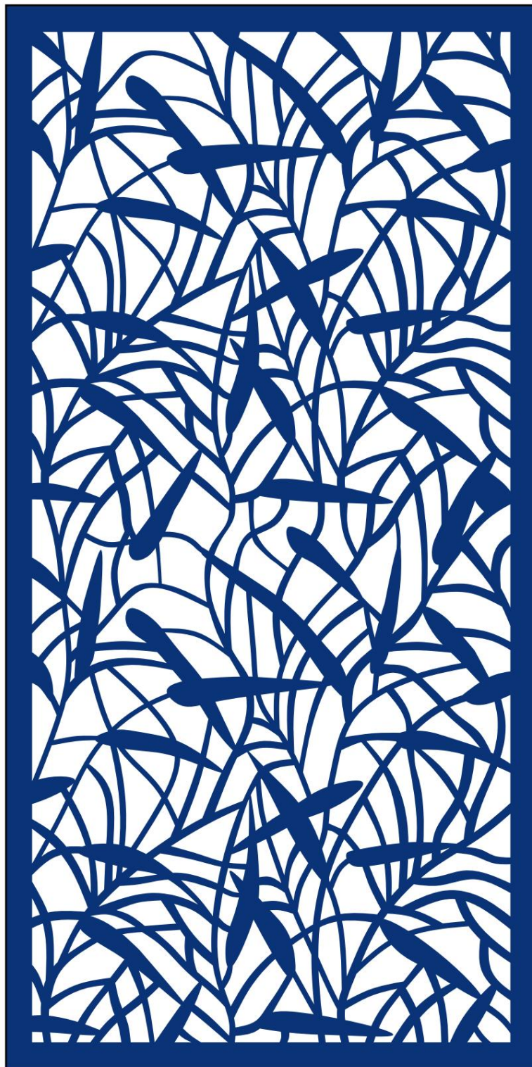
Lapminta 1000 x 2000 mm 1:10 méretarányban